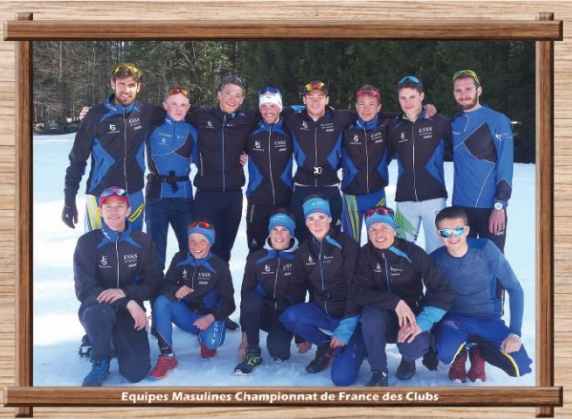
Equipes Masculines Championnat de France des Clubs