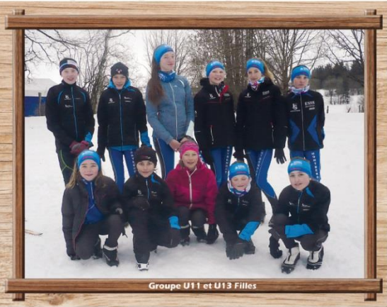
Groupe U11 et U13 Filles