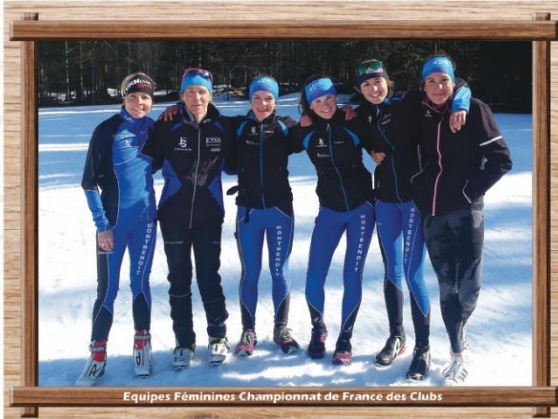
Equipes Féminines Championnat de France des Clubs