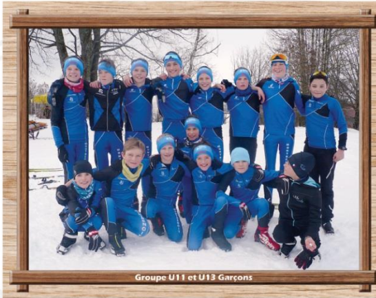
Groupe U11 et U13 Garçons